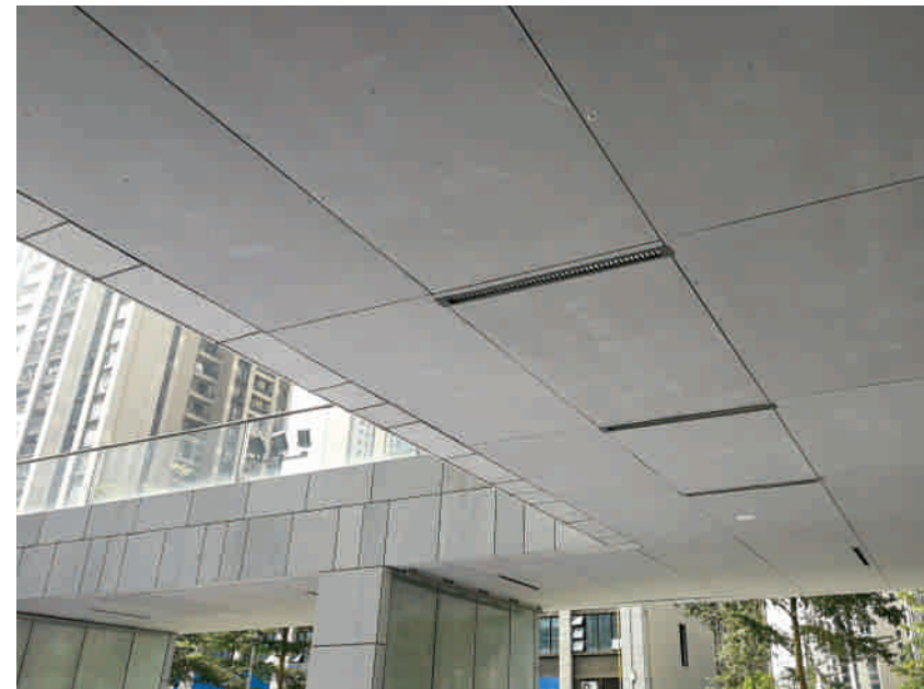
深圳坪山文化六馆 半室内吊顶、室内墙体 埃特尼特®佳美HD板