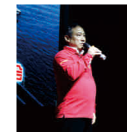
◀台上分享Safestart故事 ▶台下观众互动气氛热烈

这起事故的发生怪自己太着急、太自负了, 想着完事后赶下班, 导致工作起来有点鲁莽而引发了安全事故。幸好这起事故没有造成很大的伤害, 如