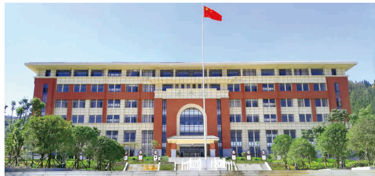
云南临沧市委党校 外墙 埃特尼特®佳美板