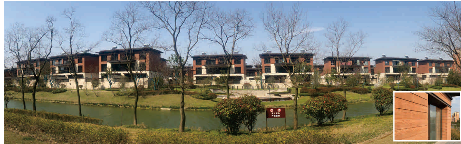
江苏省南通万科白鹭郡 外墙 埃特®赛迪板